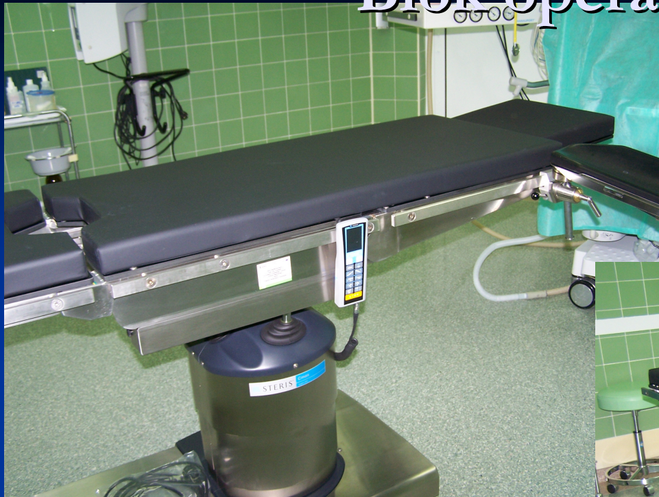
■ Stół operacyjny