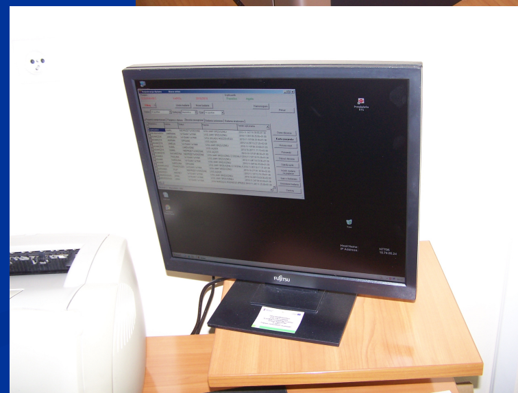
System archiwizacji i dystrybucji obrazów