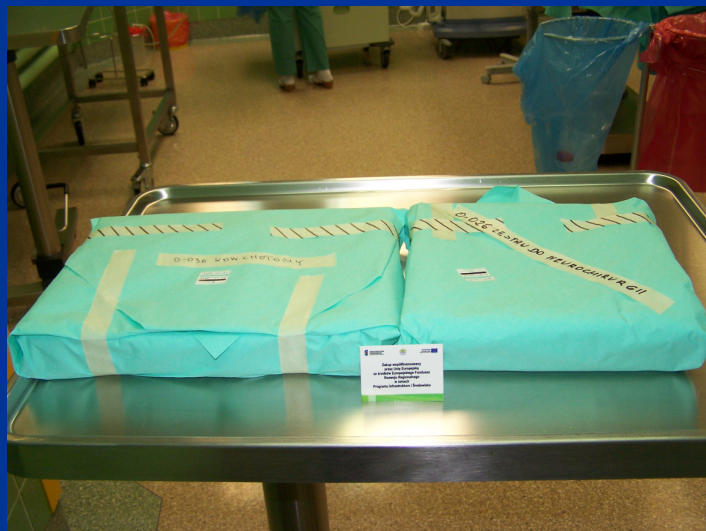
■ Instrumentarium do operacji kręgosłupa